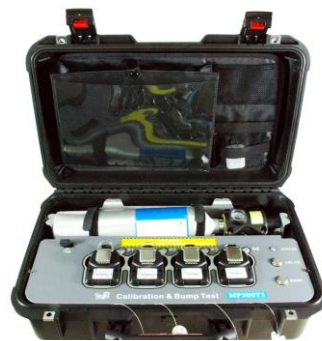
MP300T1 自动标定与测试平台